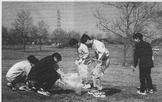
加曽利貝塚美化作業