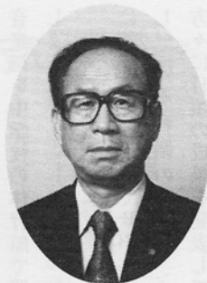
貝塚中学校区 青少年育成委員会会長

子どもたちの登下校等における安全な環境づくりを図るために、今年度「子ども110番のいえ」を青少年育成委員や地域の皆様にご利用いたしました。この事業は、子どもたちが危険を感じたら、いつでも緊急に避難できる場所を確保するために行われるものです。この事業には、小学校のPTAでも取り組んでくださっております。現在、貝塚中学校区で20か所余りの家庭や事業所に「子ども110番のいえ」のステッカーが貼られております。また、七月と十二月には「地域ぐ