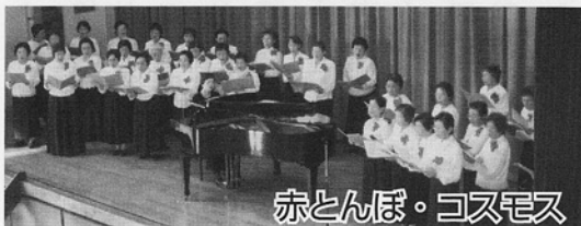
赤とんぼ・コスモス

11月13日(土)午後1時より貝塚中学校体育館を会場として地域ぐるみ音楽祭が盛大に行われました。会場が素敵なハーモニーで一杯になりました。