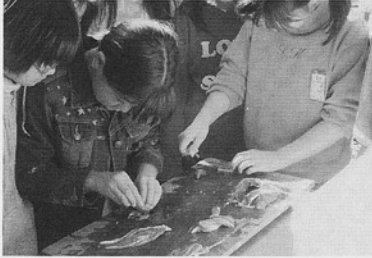
黒曜石で肉を切る子どもたち