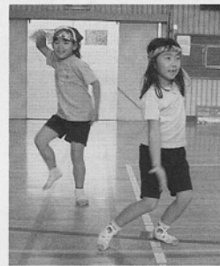
1年生 表現リズム遊び

これまでに六回の授業研究会を持ちました。ボールを使った運動や遊び、マットや鉄棒を使った運動や遊び、走り幅跳びや幅跳び遊び、リズムダンスや表現遊び、保健学習など、様々な領域にわたり、子どもの思いや願いを大切にするように工夫しました。どの授業でも、子ども達は力いっぱい動き、その運動や遊びが持っている楽しさに触れ、顔を輝かせていました。