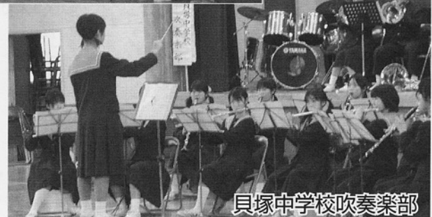
貝塚中学校吹奏楽部