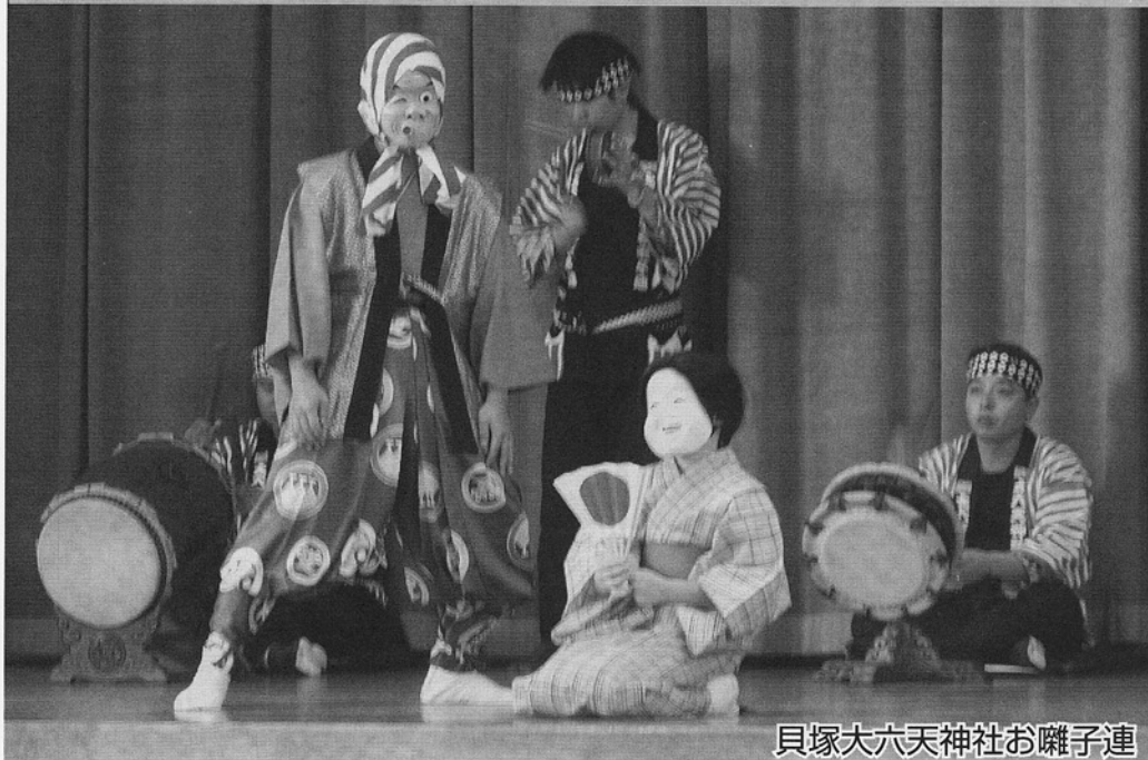
貝塚大六天神社お囃子連