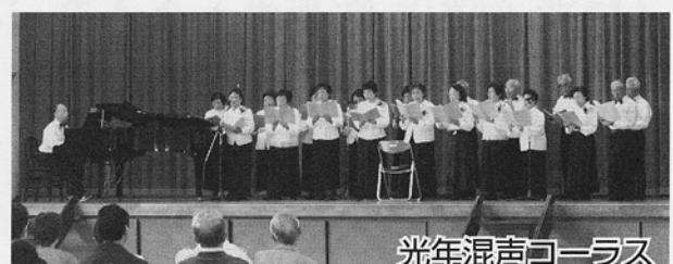
光年混声コーラス