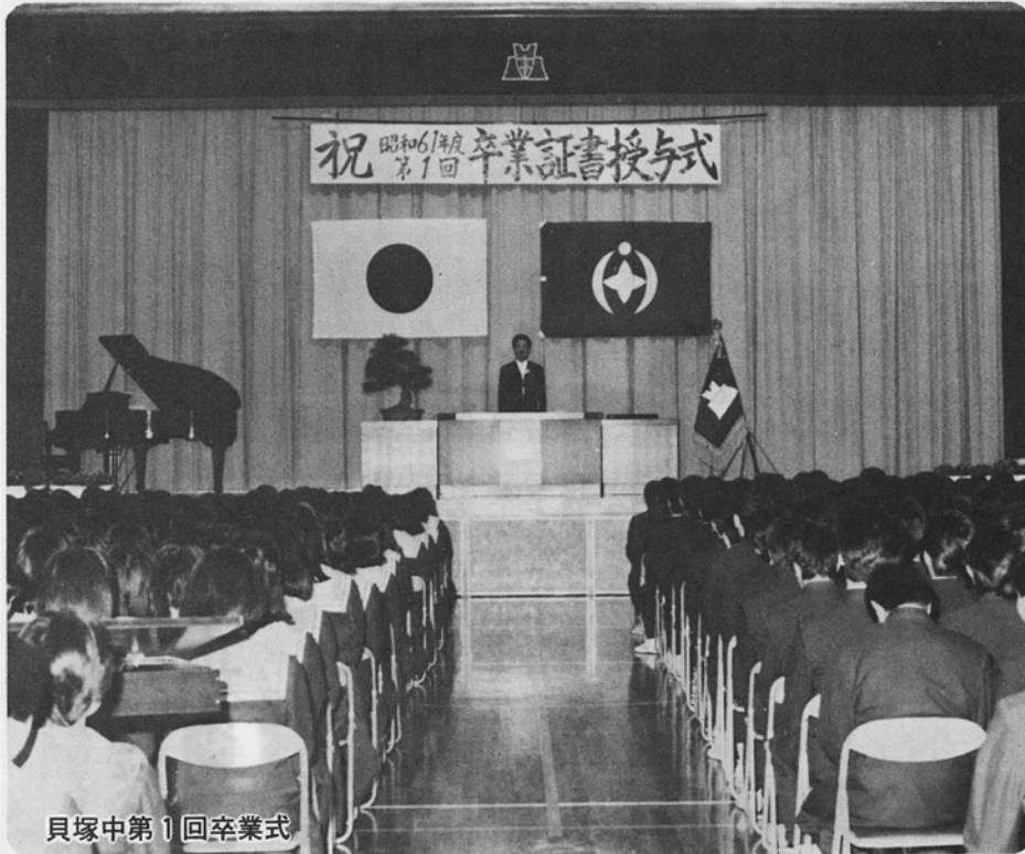
貝塚中第1回卒業式