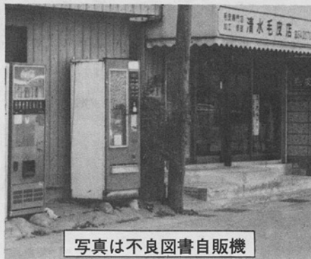
写真は不良図書自販機

青少年の健全な育成を図るためには青少年のための健全な環境づくりが急務とされるが現実の青少年を取りまく社会的環境は、享樂的風潮の強い現代において決して安穩としていられるものではなく、常に環境浄化のための諸努力をし続けなければならぬ状況にある。 特に当学区において通学路に図書自動販売機が数台設置され、大人も目をそむける内容の図書を野放図に販売し、青少年の目にさらしている現状は極めて憂うべき状況といえる。 ここに、我々、育成委員会、学校、PTAは不良図書自動販売機の撤去についてこれまで以上に地域をあげて取り組み、行政当局等にも働きかけ、万全の努力をし続けることを決議する。 昭和六十一年十二月十三日