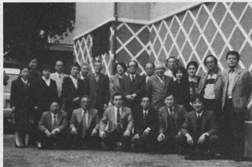
[写真]育成委員会研修旅行参加者の顔ぶれ