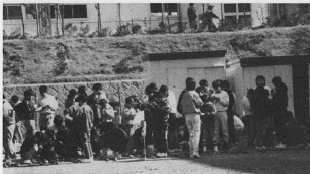
写真はグランドゴルフ大会風景

過日の夕方の散歩の折、薄暗くなったモノレールの下の広い通りで、黒い大きいビニール袋をひきずる様にした男の子三人と擦れ違いました。その後、ある会合で「北貝塚小や、桜木小では、空缶を集