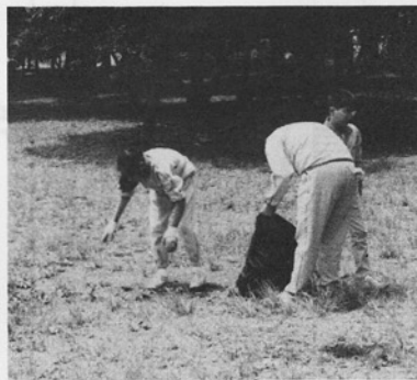
写真は貝塚中生徒の清掃奉仕活動

つていた中学生が、この日ばかりは、ほこりをかぶって真黒になりながら、小学生に負けじと真剣にがんばる姿はとてもほほえましいものでした。